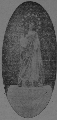
Imágenes traídas por el templo de la Dolorosa y bendecidas en días pasados, con motivo de lo cual se celebró una bella y hermosa fiesta religiosa en aquella Iglesia.