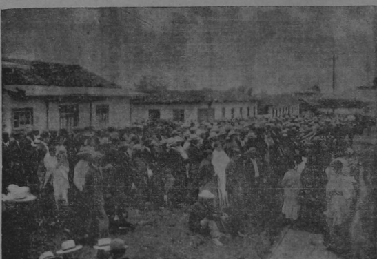
El pueblo congregado en la calle, junto á la casa del padre Benito, en momentos que aquel modesto y virtuoso sacerdote fué aclamado calurosamente.